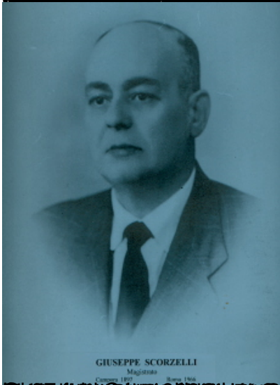
GIUSEPPE SCORZELLI Magistrate Consiglio 1891 Roma 1966